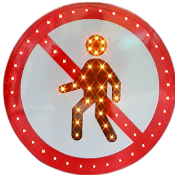
Prohibido paso peatón

Tiempo función: carga de 8h = 360h sin carga